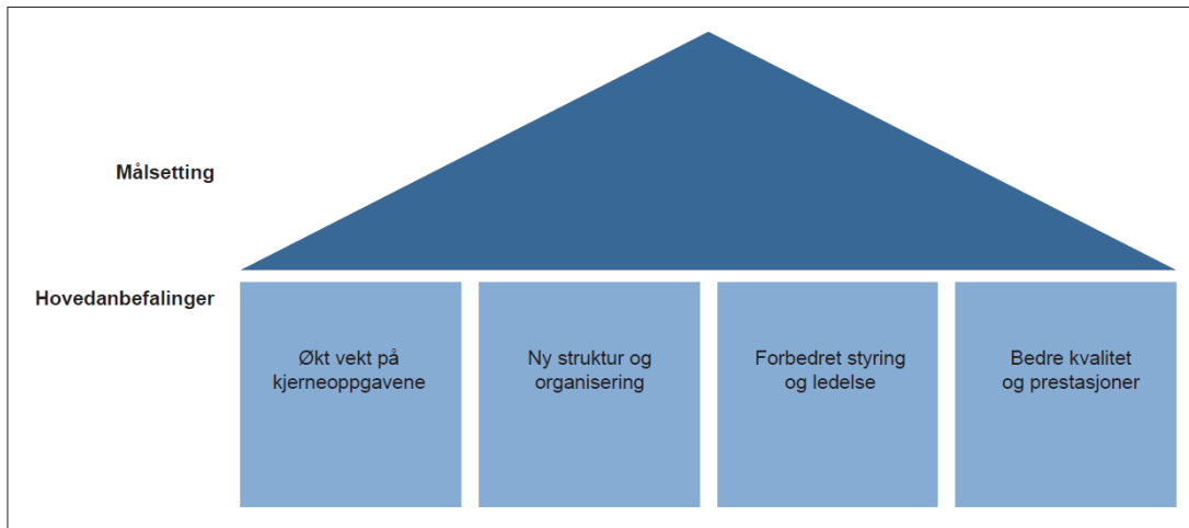
Figur 4.1 Målsetting og hovedanbefalinger

Nedunder er vist figur som viser framlegget om å redusera politidistrikta til seks regionar, slik utvalet tilrår.