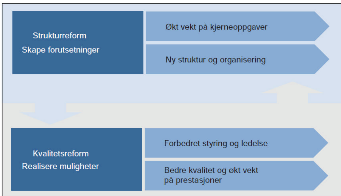
Figur 9.1 Utvalgets samlede anbefalinger

Utvalget har oppsummert sine anbefalinger slik i rapporten;