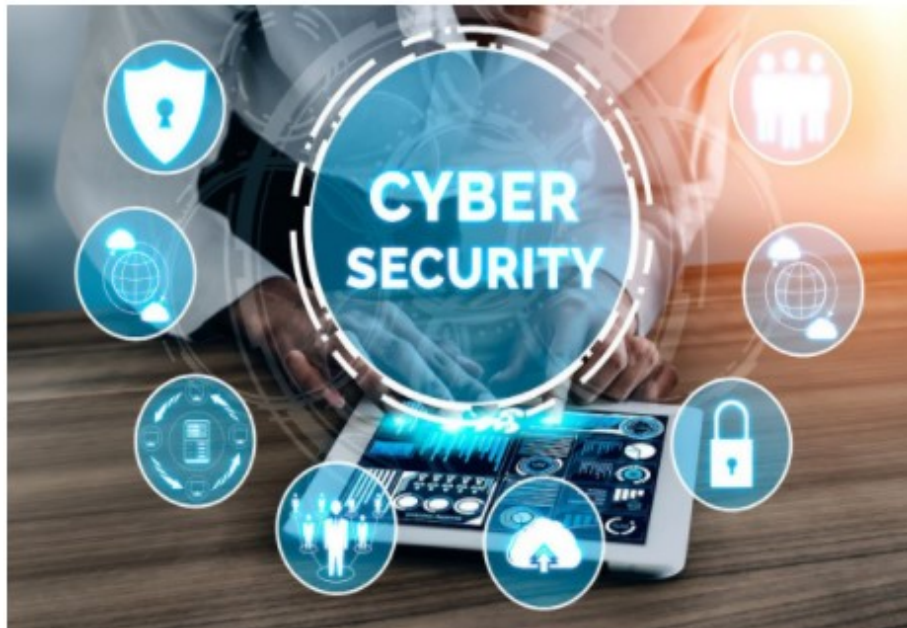
Et europeisk kompetansesenter for cybersikkerhet diskuteres i EPs ITRE-komitee.

I møte 6. juli diskuterte ITRE-komiteen blant annet etableringen av et europeisk kompetansesenter for cybersikkerhet ( European Cybersecurity Industrial, Technology and Research Competence Centre ) samt Strategi for europeiske små- og mellomstore bedrifter.