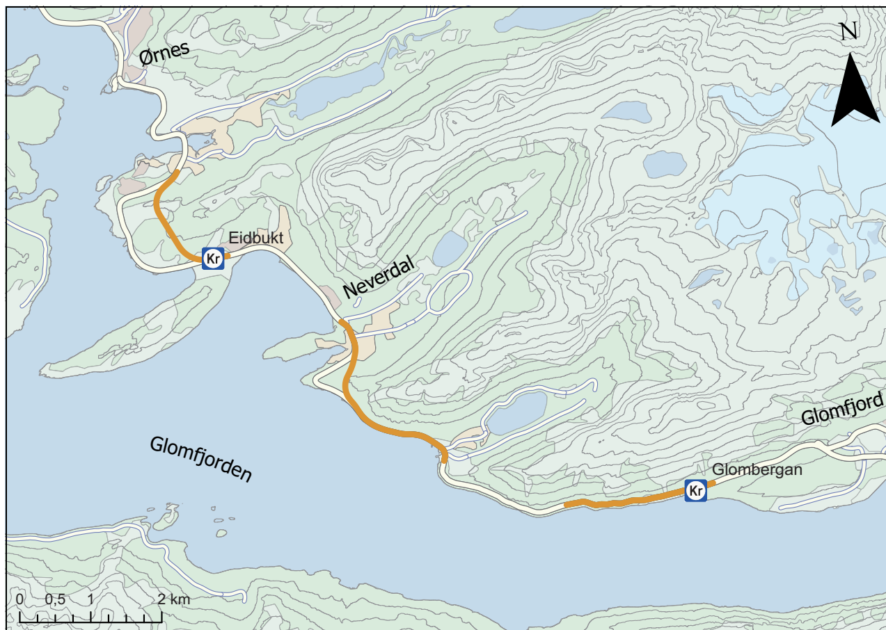
Figur 6.1 Kart som viser delstrekninger og bomstasjonsplasseringene Eidbukta og Glombergan på fv. 17.

Det er videre lagt til grunn et passeringstak på 60 passeringer per bomstasjon per kalendermåned for kjøretøy i takstgruppe 1, for å skjerme lokaltrafikken. All rabatt og redusert takst forutsetter gyldig brukeravtale og brikke. Ellers gjelder de til enhver tid gjeldende takstreningslinjer for bompengeprojekt.