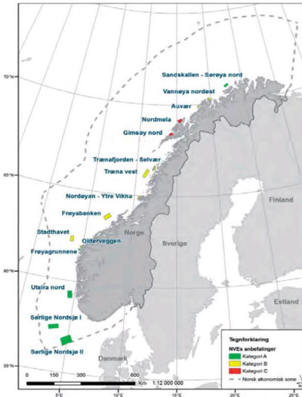
Figur 2: Lokalisering av områda NVE har greia ut om. Dei aktuelle områda for dette forslaget er «Kategori A» områda. Disse er markert i grønt.