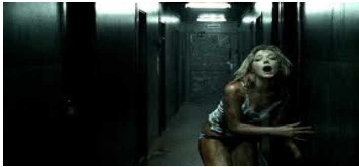
(Fra "Fritt Vilt 1")

statlige krone. Kvalitetsmessig kan det også vises til meget gode resultater. Registreringen av fondenes betydning for regional utvikling gir et noe unyansert bilde av satsingens verdiskaping i denne regionen. I de årene Film3 har eksistert, har det vært en svært positiv vekst i filmnæringene i Innlandet. Dette må imidlertid bygges og måles over lengre tid. Selv om noen av selskapene som har fått filmstøtte, har sitt hovedkontor utenfor regionen har alle filmprosjektene bidratt betydelig til verdiskaping i regionen, både gjennom omsetning/tjenester i produksjonsperiodene og samarbeid med regionens filmbransje. Film3 har erfart at nærheten til det store filmmiljøet i Osloregionen også kan gi gode samarbeidsrelasjoner i oppbygging av filmbransjen i Innlandet.