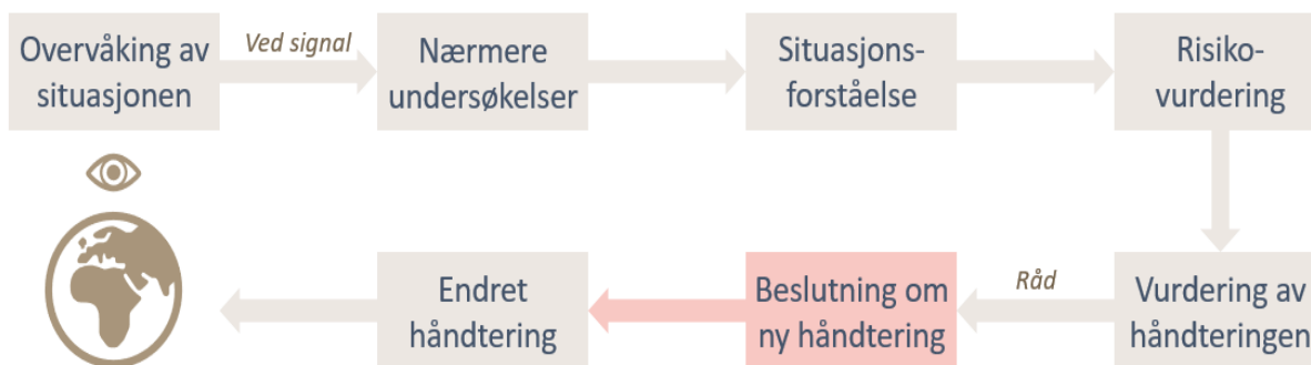
Figur 1 – Trinn ved håndtering av en negativ utvikling i pandemien