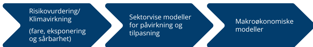
Figur 4.2 Eksempel på prosess med soft-linking