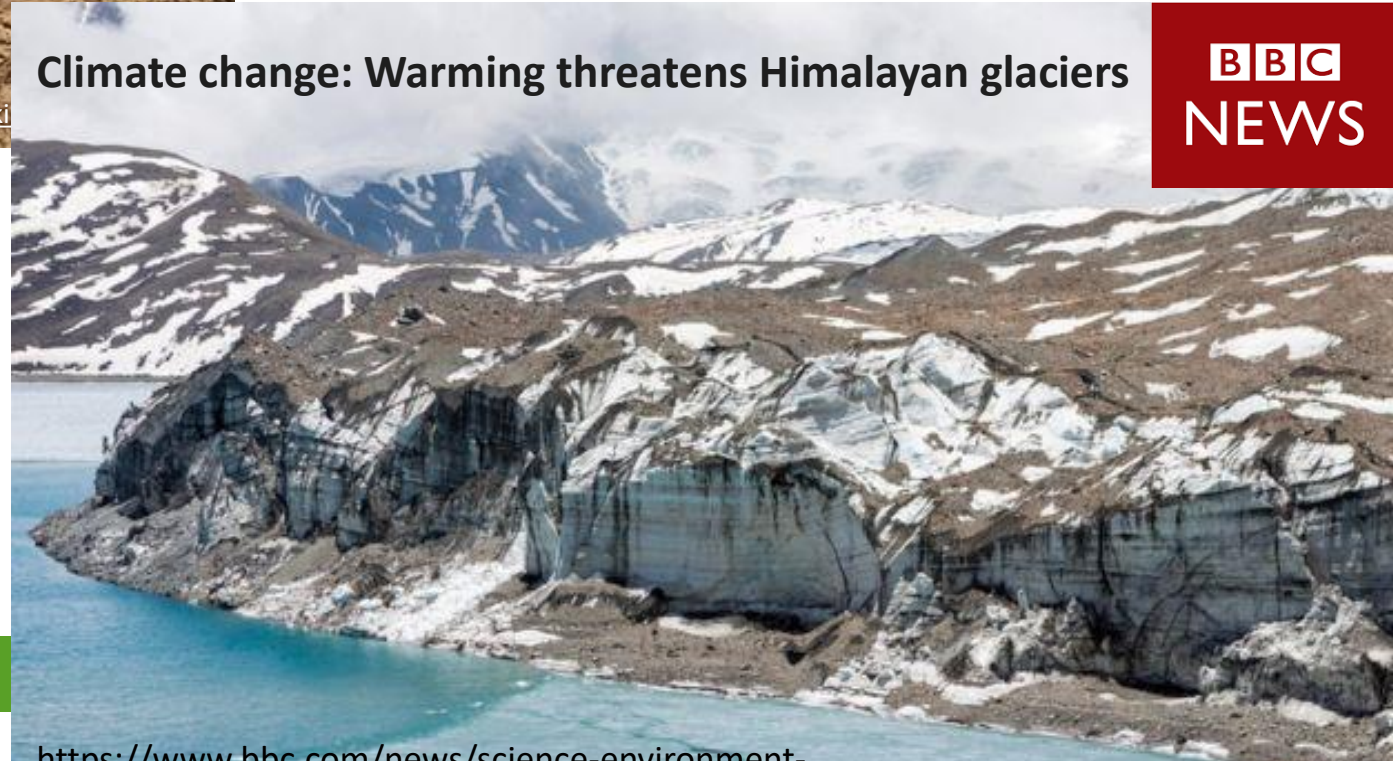
Regional warming in the decade 2006-2015 relative to preindustrial