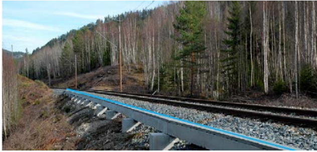
Figur 3.2. Kanal anlagt på grunnen langs jernbane, egnet til framføring av andre infrastrukturprosjekt som f.eks. ekom.