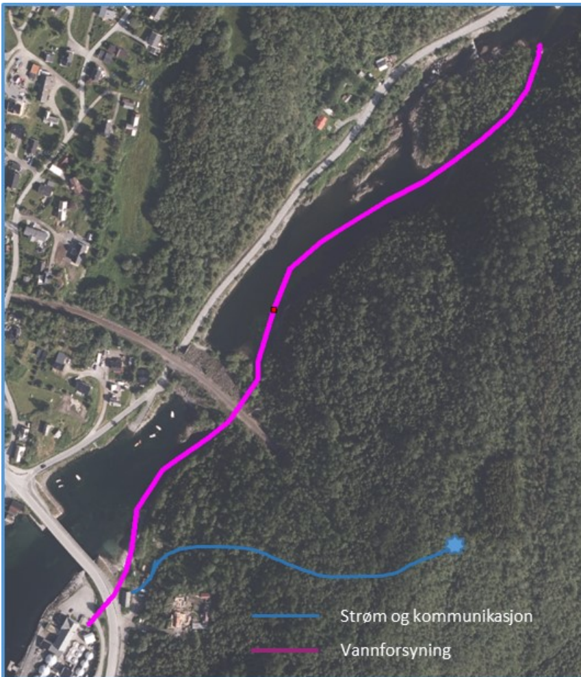
Figur 3.3. Inntaksledning for privat vannforsyning. Nedgravd ledninger for strøm og kommunikasjon til mobiltelefonmast