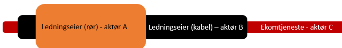
Figur 3.1. Eksempel på ansvarsdeling mellom ulike aktører for å føre fram en ekomtjeneste.

I mange tilfeller vil ansvaret for tjenesteinnhold og framføring være skilt. Anleggseier vil da være den som har ansvaret for framføringsveien, ikke innholdet. Figur 3.1 illustrerer et eksempel der aktør A stiller et trekkør til disposisjon for framføring av en bredbåndskabel tilhørende aktør B som i sin tur stiller kabelen til disposisjon for aktør C som tilbyr ekomtjenester til sluttbrukeren. Anleggseier vil i dette tilfellet være aktør A. Uten trekkøret vil anleggseier være aktør B.