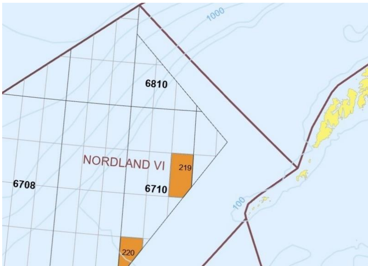
Kart som viser PL 219 og PL 220 i Nordland VI. Illustrasjon: Oljedirektoratets sokkelkart

Vi har gjennom lang tid stått urokkelig fast på et klart nei-standpunkt i forhold til spørsmålet om offshore petroleumsvirksomhet i våre nære havområder. Områdene Nordland VI, Nordland VII og Troms II er i dag ikke politisk åpnet for slik virksomhet, og vi tar for gitt at arbeidet med næringsplanene ikke vil endre på denne statusen. Vi registrerer på den annen side at to letelisenser fortsatt er aktive i Nordland VI (PL 219 og PL 220) utenfor Røst og Værøy. I 2016 krevde et enstemmig årsmøte i Nordland Fylkes Fiskarlag at daværende regjering snarest måtte trekke tilbake de gamle letelisensene i Nordland VI. Vi reagerer på at petroleumsforvaltningen gang på gang har utvidet tidsforlengelsen i disse gamle letekonsesjonene, som ble tildelt i 1996. I dag er det flertall imot åpning av disse områdene på Stortinget, og skiftende regjeringer gjennom hele seks stortingsperioder har holdt Nordland VI lukket for leteboring. Vi krever derfor at Regjeringen nå gjør aktive grep, og inndrar disse to lisensene en gang for alle.