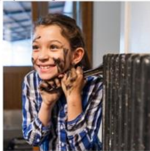
Erstatte gammeldags oppvarming