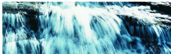
Norsk Industri er fornøyd med at Norges vassdrags- og energidirektorat har påført sin kommunikasjons- og opprinnelsesgarantier.