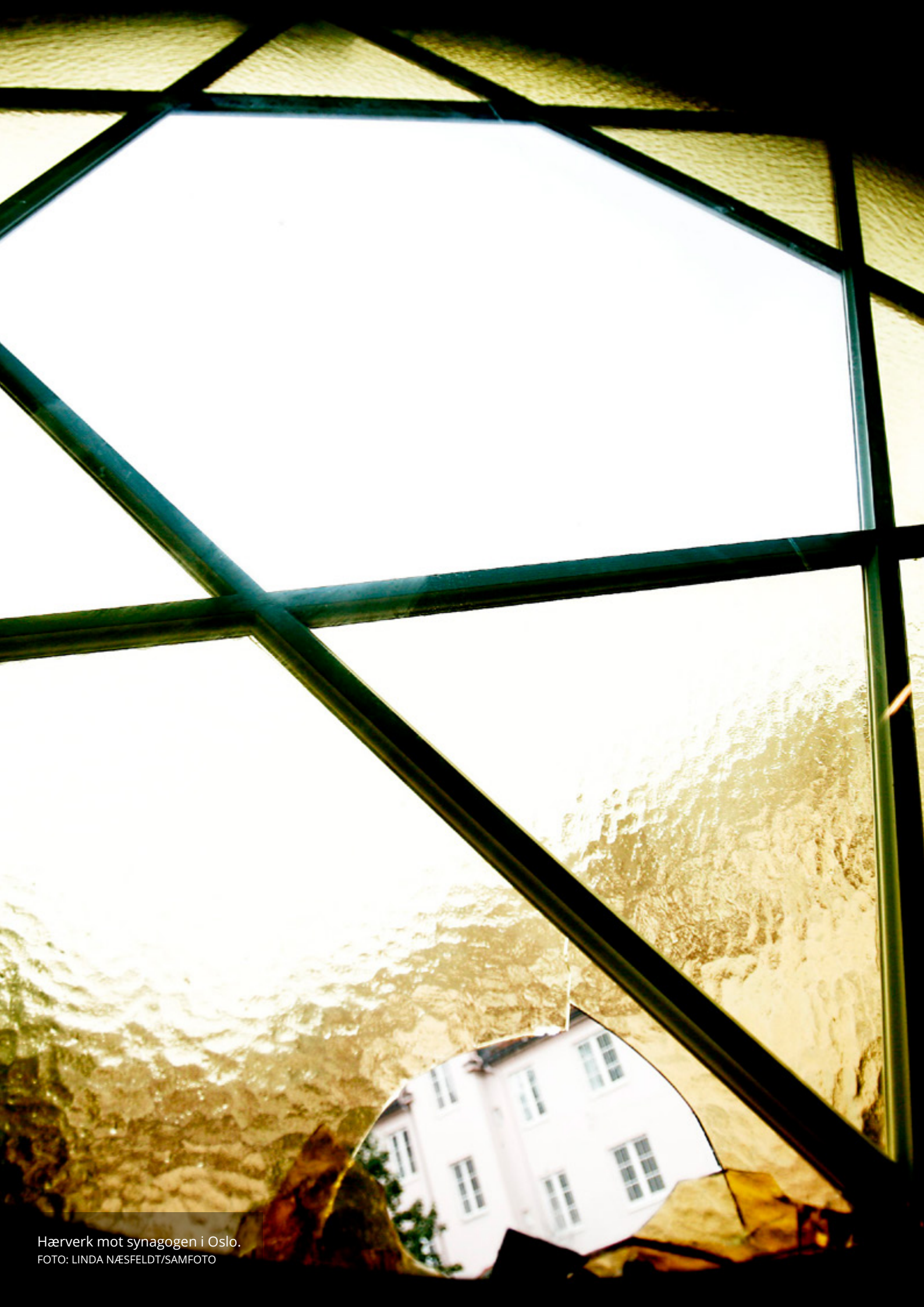
Hærverk mot synagogen i Oslo.