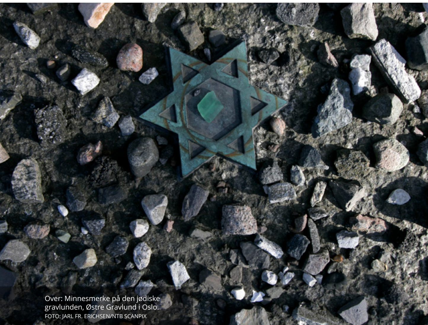
Over: Minnesmerke på den jødiske gravlunden, Østre Gravlund i Oslo.