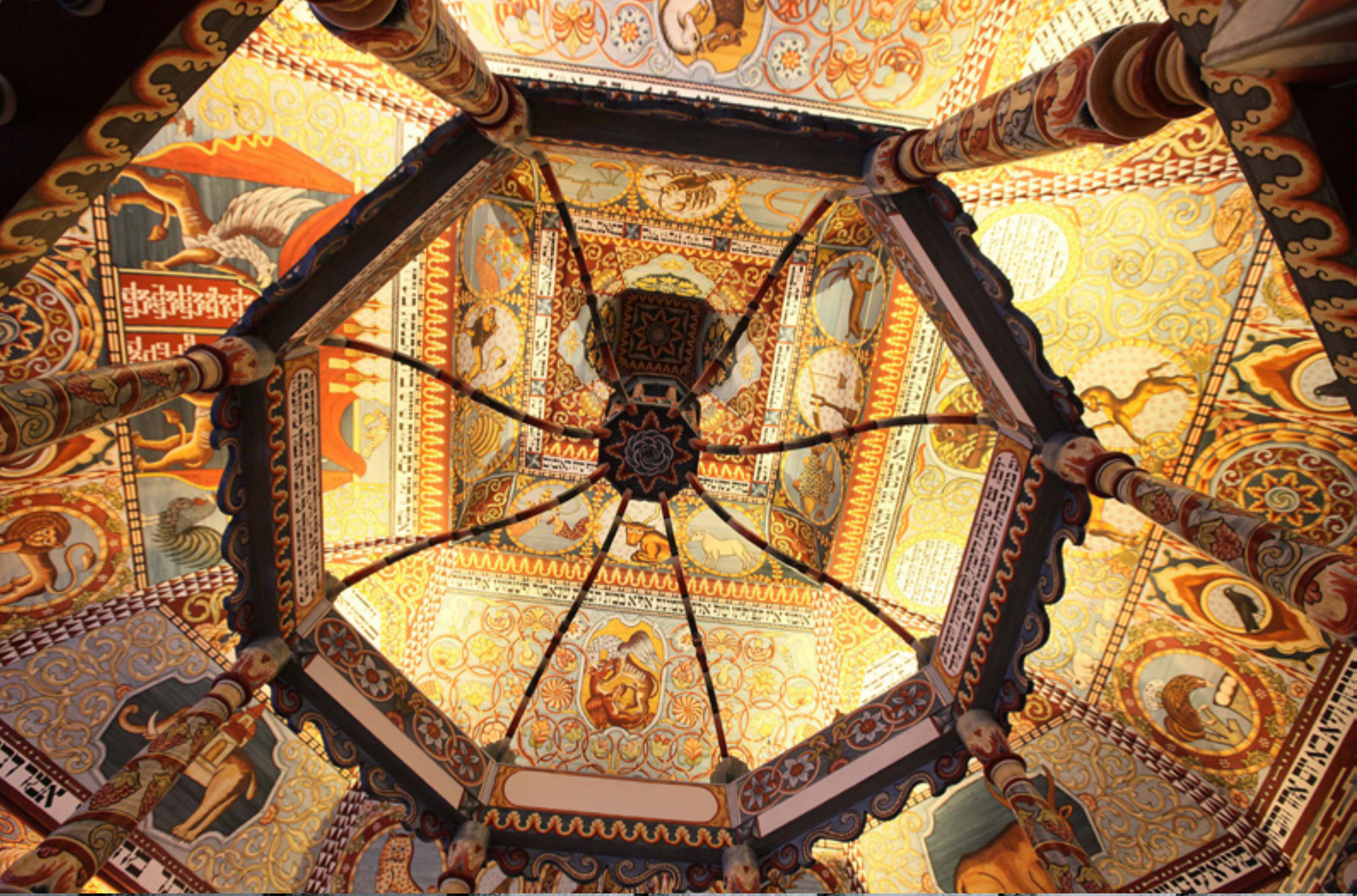
Bilder fra POLIN Museum of the History of Polish Jews i Warszawa, Polen.