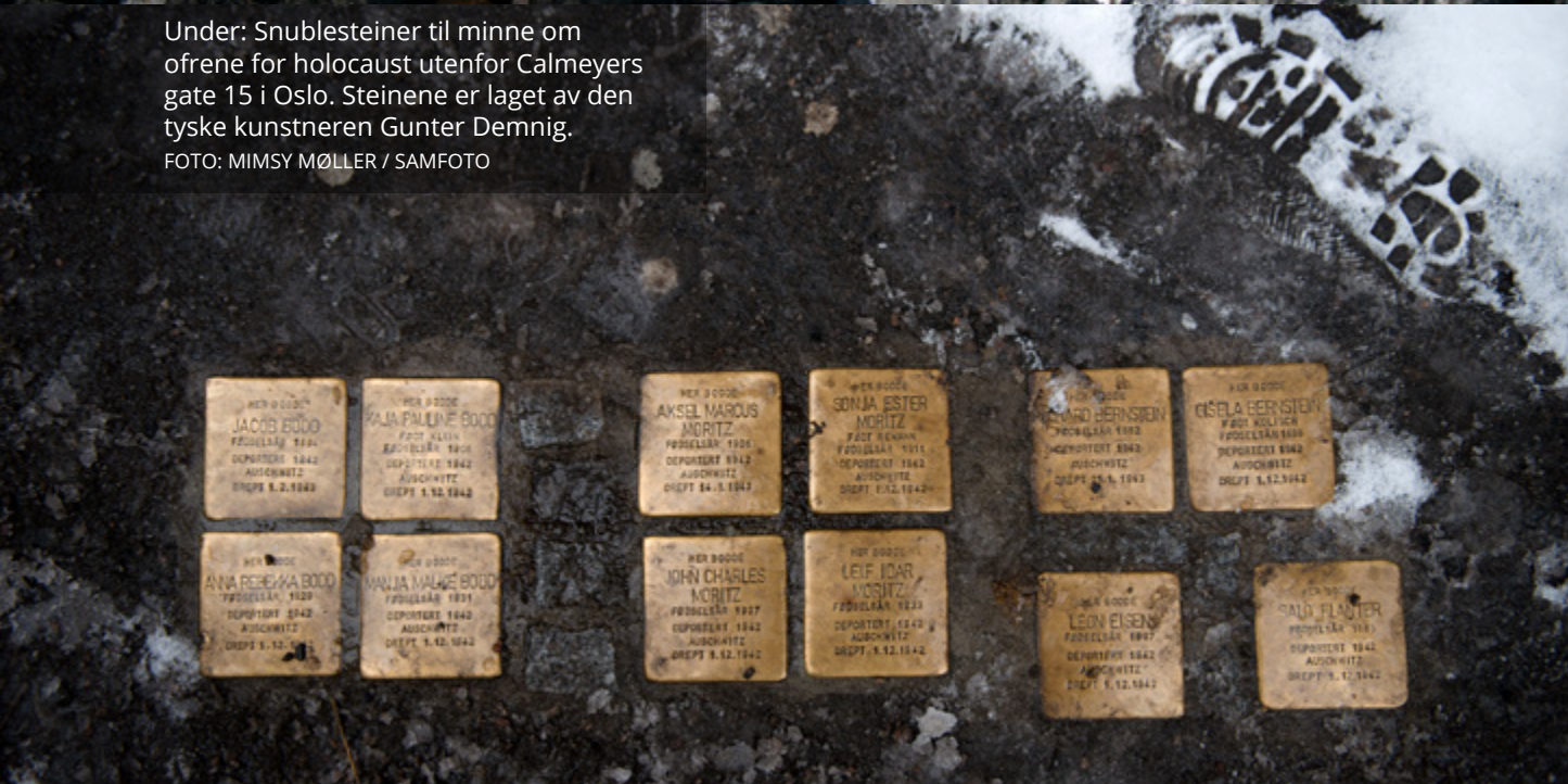
Under: Snublesteiner til minne om ofrene for holocaust utenfor Calmeyers gate 15 i Oslo. Steinene er laget av den tyske kunstneren Gunter Demnig.