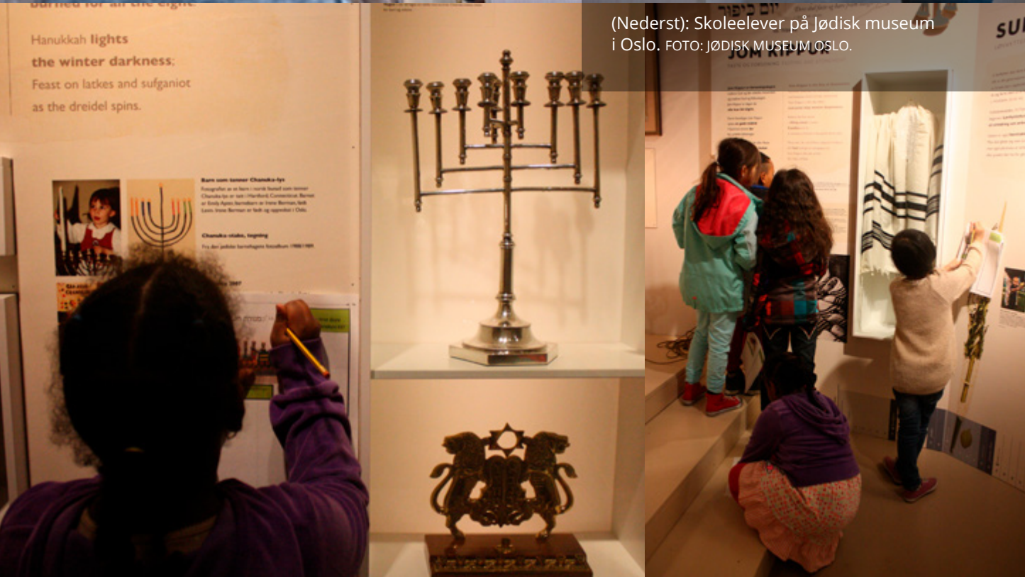
(Nederst): Skoleelever på Jødisk museum i Oslo.