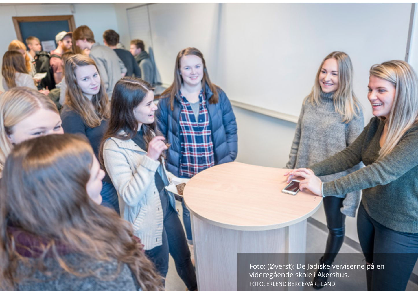
Foto: (Øverst): De Jødiske veiviserne på en videregående skole i Akershus.