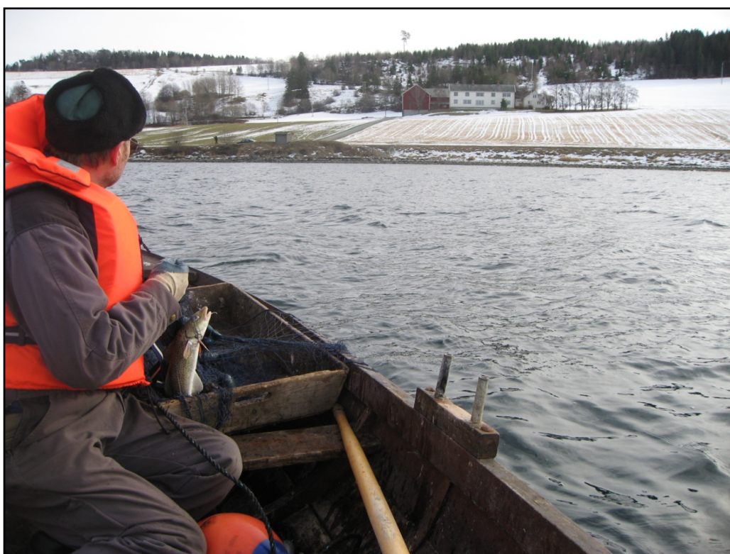
Inn på tunet byr på gode opplevelser og nyttige aktiviteter.

Figuren gir en foreløpig oppsummering av allerede ivarettatte tiltaksområder, områder med behov for styrking og nye tiltaksområder, og vil danne utgangspunkt for det videre arbeidet med handlingsplanen.