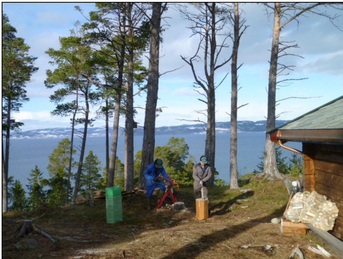
Skogen og utmarka byr på varierte arbeidsoppgaver.

IPT-satsingen skal utvikle samfunnsnyttige velferdstjenester med gården som arena. Grunnet at å utvikle gården som arena er at gårdsressursene kan styrke håndteringen av samfunnets velferdsoppgaver. Dette kan oppfylles enten ved at tjenestene tilfredsstillende gjeldende kvalitetsstandarder med økt mulighet for individ- og brukertilpasning, eller at gitt kvalitet kan fremskaffes på en mer effektiv måte.