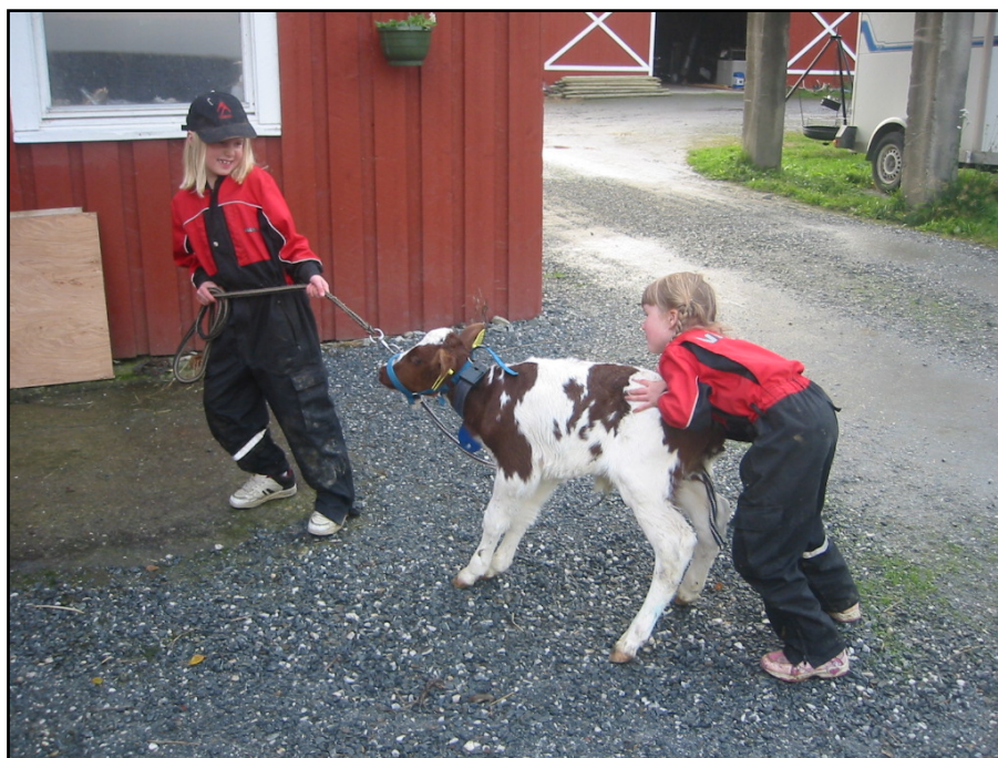
Barn og kalv.

Opprinnelig ble det brukt ulike begreper om gårdsbrukets velferdstjenester, som Grønn omsorg, Gården som pedagogiske ressurs og Levande skule. Inn på Tunet (IPT) som begrep er nå på vei til å bli innarbeidet i Norge. I andre land brukes begreper som bl.a. Green Care, Care Farming, Farms for schools, Social Farming eller Farming for health.