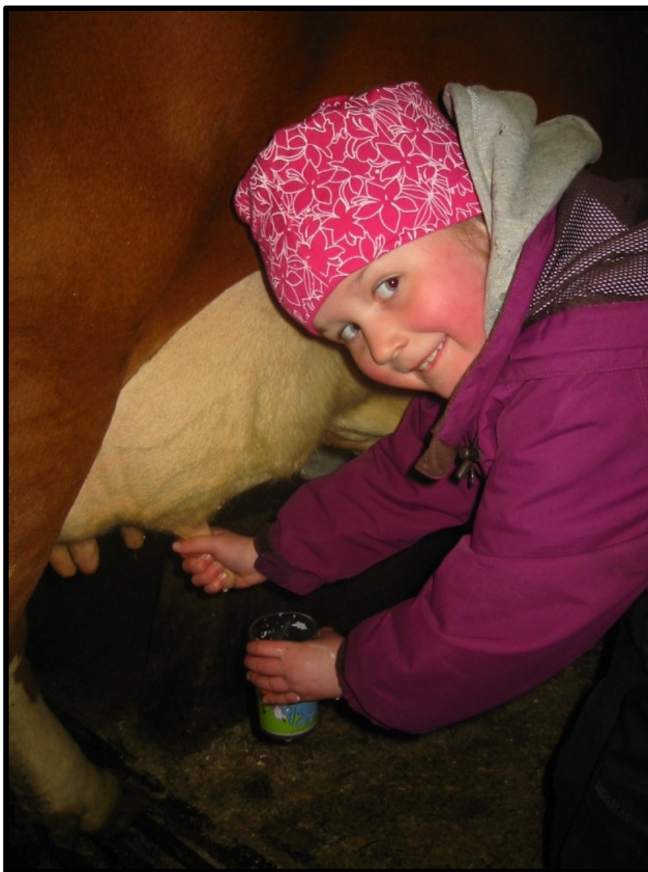
Stolt budeie , Foto: Kari Myklebust

Inn på tunet er også et prioritert satsingsområde i de regionale næringsstrategiene . Disse strategiene er førende for fylkesvis prioritering av økonomiske virkemidler til tiltak på landbrukseiendommer. Fylkesmennene har en aktiv tilrettelegger- og utviklerrolle i samarbeid med det regionale partnerskapet. Inn på tunet er også tema i fylkesplaner og andre regionale planer. I flere fylker bl.a. i Hordaland, Finnmark og Nord-Trøndelag er det laget egne handlingsplaner for Inn på tunet. I en undersøkelse hos fylkesmennene januar 2011 ser vi at planforankringen på regionalt og lokalt plan i stor grad er knyttet til landbrukets planer og strategier. I flere kommuner er Inn på tunet nevnt i de kommunale landbruksplanene, næringsplaner og omsorgsplaner .