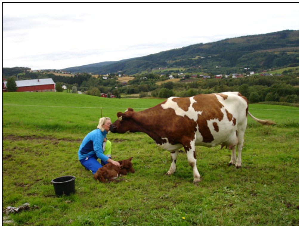
Kontakt mellom mennesker og dyr er en viktig del av Inn på tunet.

Tilbydernettverk er opprettet i mange fylker. I Nordland har det lenge eksistert et samvirke som formidler gårdsferie for barn og unge, Gårdsferie Nord BA. Vi finner samvirker både i Trøndelag og i Oslo og Akershus. I Hedmark, Rogaland og Hordaland finner vi eksempler på interesseorganisasjoner som er etablert for å ivareta faglige og sosiale nettverk hos tilbyderne