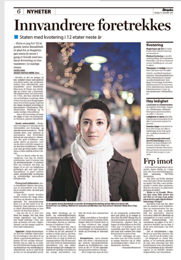
Faksimile Aftenposten 19.12.2007