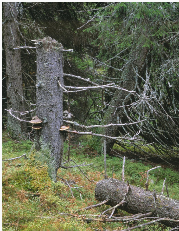
Urskog – Ormtjernkampen nasjonalpark