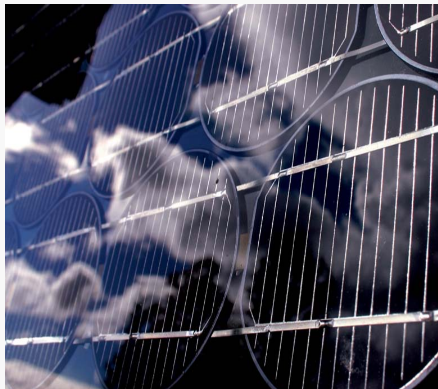
Del av solcelleveggen på elektrobygget, Gløshaugen