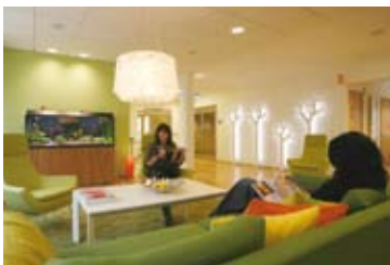
Miljön är viktig. Trygghet, värme och hemkänsla är ledord som arkitekten arbetat efter.