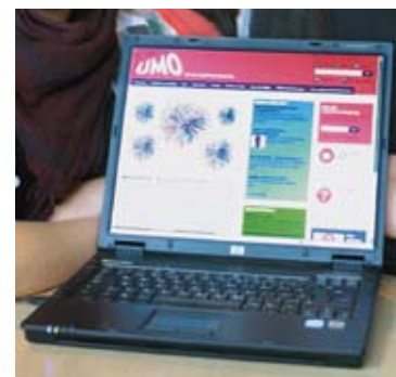
På UMO finns även förebyggande material om våld, kränkningar och diskriminering.

Om man har blivit utsatt för ett övergrepp finns bra information om var man kan vända sig.”