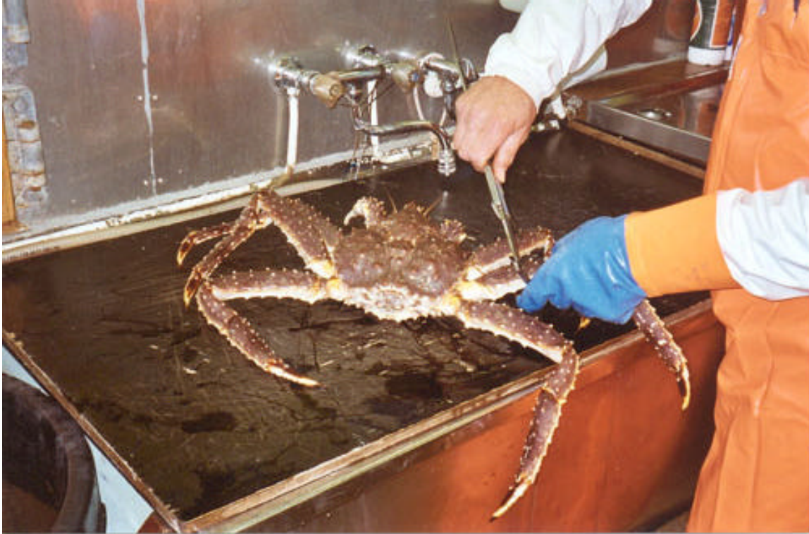
Merking av Kongekrabbe under forskningstokt med F/F "Johan Ruud" i Varangerfjorden august 2001.