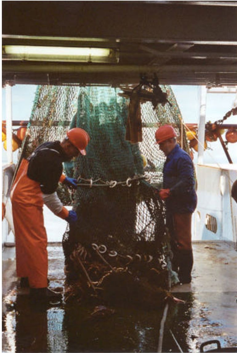
Forskningstokt med F/F "Johan Ruud". Kartlegging av utbredelse og omfang av Kongekrabbe i Varangerfjorden august 2001.