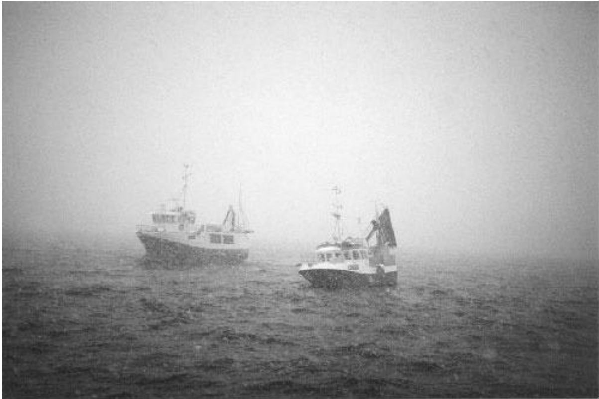
Lofotfiske mars 2001.