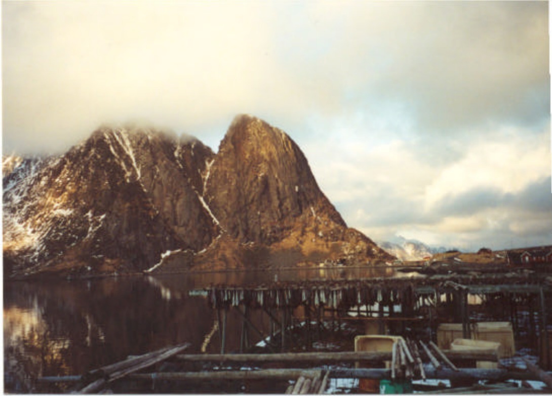
Fisk på hjell ved Reine i Lofoten mars 2001.