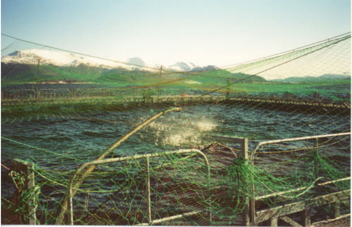
Fôring i matfiskanlegg ved Ålesund mars 2001.