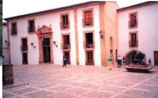
Revitalisering av gamlebyen Jávea, Spania