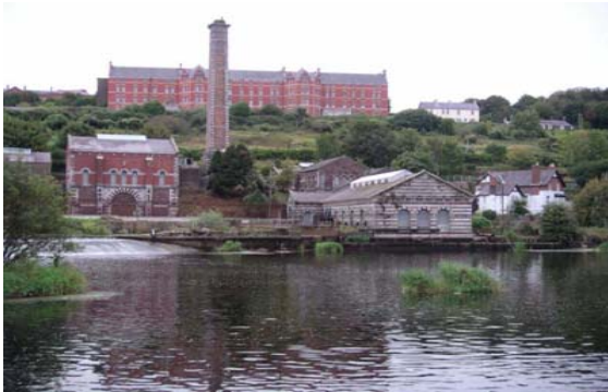
Lifetime Lab project Cork, Irland

- eksempler fra tidligere finansieringsordninger