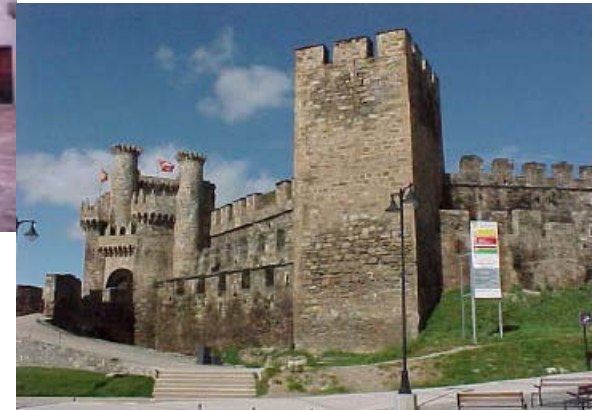
Slottsrestaurering Ponferrada, Spania