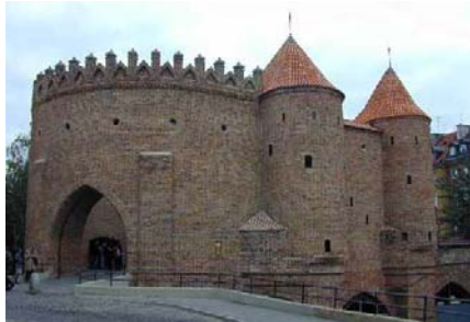
Barbakan Slott, Polen