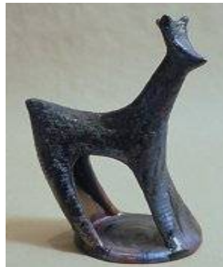
Objekt fra utstilling i Litauen