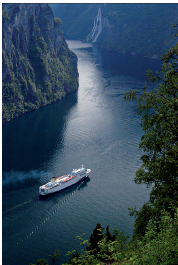
Figur 2 Turistbåt på vei ut Geirangerfjorden. Cruiseskip ved Geiranger. Fossen De sju søstre i bakgrunnen.

Dagens fylkeskommuner finansieres i hovedsak gjennom frie inntekter. Regjeringen mener dette prinsippet også bør legges til grunn for finansiering av de nye regionene. Det kan imidlertid være aktuelt å øremerke noen midler på enkelte av de nye oppgaveområdene.