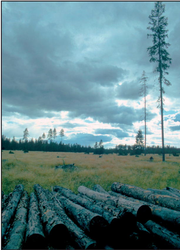
Figur 7 Hogstflate.