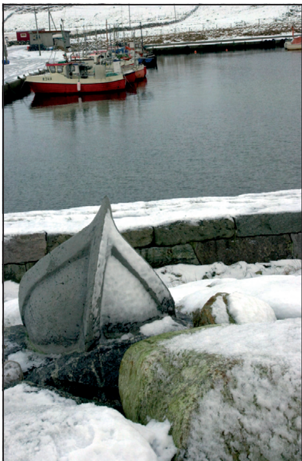
Figur: 1 Stort anlagt utendørs kunstverk («Konvoy». av Elisabeth Jarstø), forestiller båter som synker i storm. Ved Obrestad havn, med nysnø. Jæren.

Fylkeskommunen har ansvar for videregående opplæring, fagopplæring i arbeidslivet og voksenopplæring. Herunder har den også ansvar for faglig pedagogisk utviklingsarbeid og spesialpedagogiske tiltak i tillegg til etterutdanning av undervisningspersonell, og planlegging, utvikling og kvalitetssikring av opplæringen.