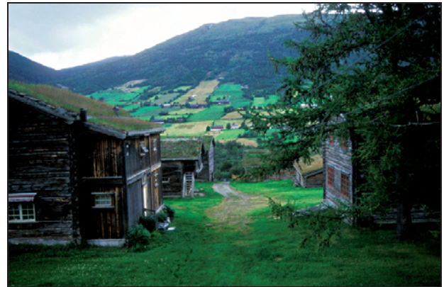
Figur 3 Uppigard Skjåk.

Landbruk- og matområdet: De fleste av fylkesmannens oppgaver på landbruks- og matområdet, med unntak av klagebehandling, kontroll med tilskuddsforvaltningen, innsigelse, lovlighetskontroll og enkelte saker med vedtaksmyndighet, skal i utgangspunktet overføres til regionene. Dette må imidlertid vurderes nøye i hvert enkelt tilfelle, og det må skje på en måte som sikrer våre muligheter til å nå våre nasjonale landbrukspolitiske mål og våre internasjonale forpliktelser på området. Fylkesmannen får ansvar for veiledning