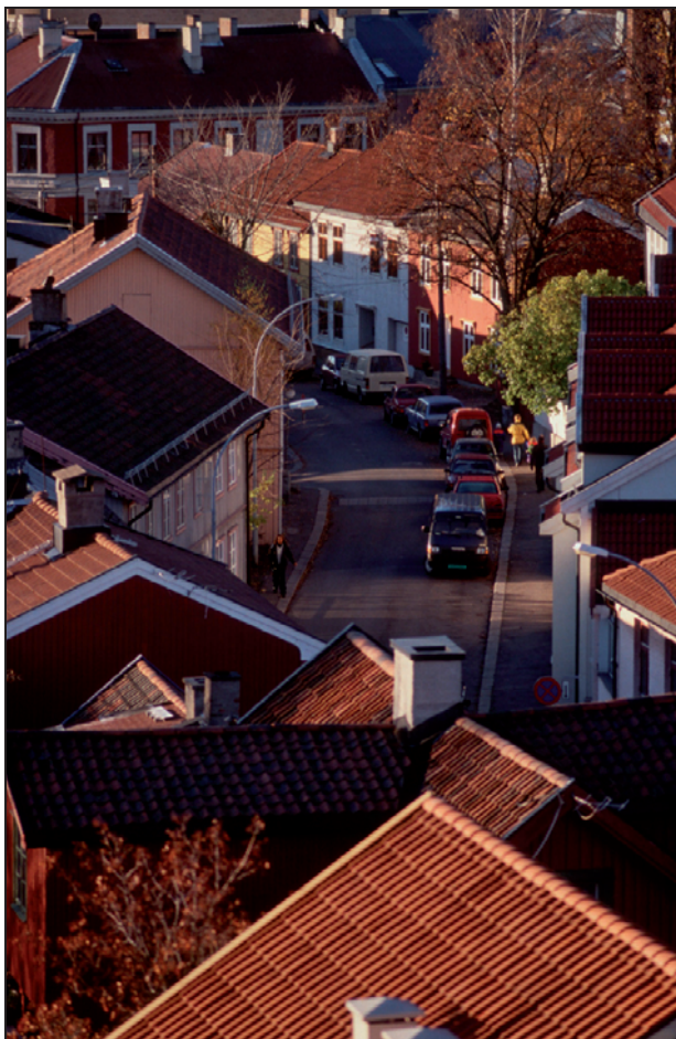
Figur 1 Oversikt av Normannsgate. Trehus på Kampen. Oslo.

Fylkeskommunene har i ulik grad lyktes som sentral drivkraft og tilrettelegger for regionalt utviklingsarbeid. Fylkeskommunene har blitt tapet for sentrale oppgaver samtidig som den folkelige oppslutningen om nivået er blitt svekket. Dette har satt fylkeskommunen som forvaltningsnivå under press. Undersøkelser viser at flertallet av fylkeskommunene ikke har hatt noen stor suksess som regional utviklingsaktør. Det er imidlertid store variasjoner i hvor mye midler hver fylkeskommune har til regionalt utviklingsarbeid, og fylkeskommunene har ulike tradisjoner og forut-