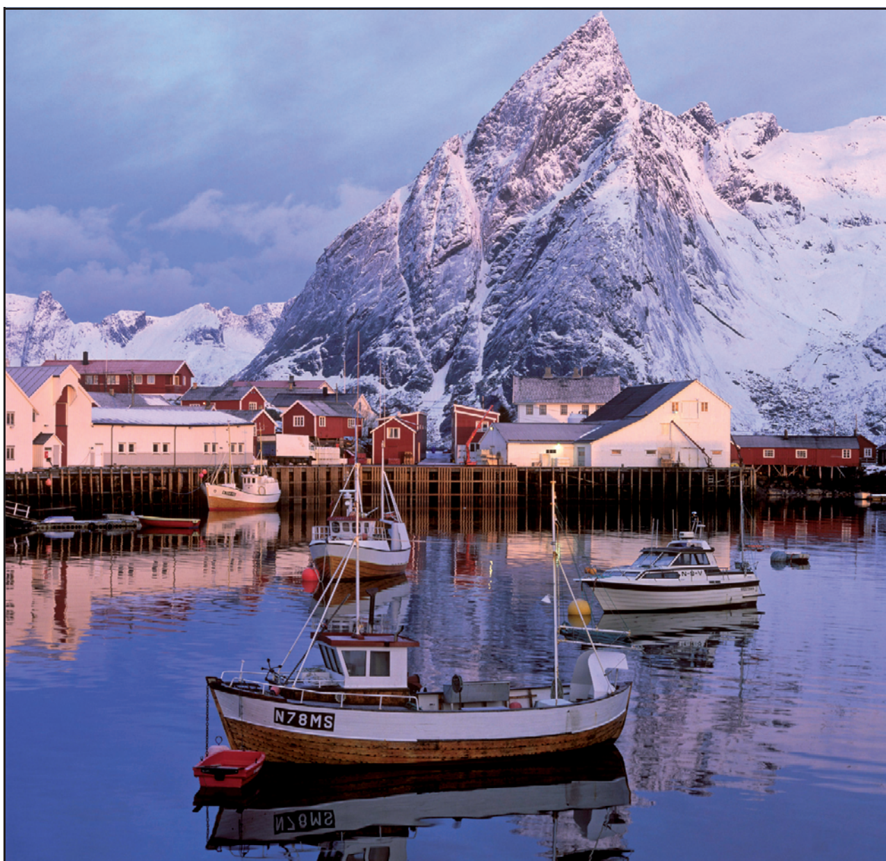
Figur 5 Fiskeskøyter på hamna i Hamnøy en tidlig morgen.

Dersom flere fylkeskommuner slutter seg sammen, eller dersom det gjøres endringer på tvers av fylkesgrenser, kan det imidlertid være aktuelt med ekstraordinært valg til regionting i 2009 i hele eller deler av landet. Dersom den fylkesvise gjennomgangen viser at det skjer endringer på regionalt nivå som krever nytt valg, vil regjeringen komme tilbake til Stortinget med forslag til lov som muliggjør dette. I tilfelle vil det bli aktuelt å avholde ekstraordinært valg i 2009 sammen med valg til Stortinget. Nødvendige lovendringer vil bli fremmet våren 2008 i forbindelse med framleggelse av forslag om inndelingsendringer på regionalt nivå.