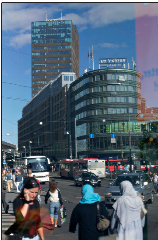
Figur 4 Speiling av trafikk og flerkulturell gateliv i Oslo sentrum foran Oslo City og Byporten.

Dersom det blir få regioner, kan flere oppgaver på samferdsels- og kulturområdet overføres til regionene, i tillegg til kjernen av nye oppgaver omtalt over. På samferdselsfeltet kan omklassifi-