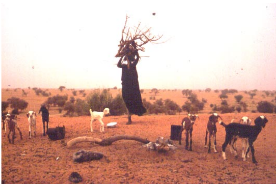
Omtrent halvparten av verdens forbruk av trevirke går til brensel, som er så å si den eneste energikilden for 2/5 av verdens befolkning.

Regjeringen legger opp til at Norge skal delta aktivt i internasjonal skogpolitikk. Norge kan bidra konstruktivt til utvikling av bærekraftig skogbruk globalt. Det er dessuten viktig å sikre at internasjonale avtaler ivaretar norske interesser.