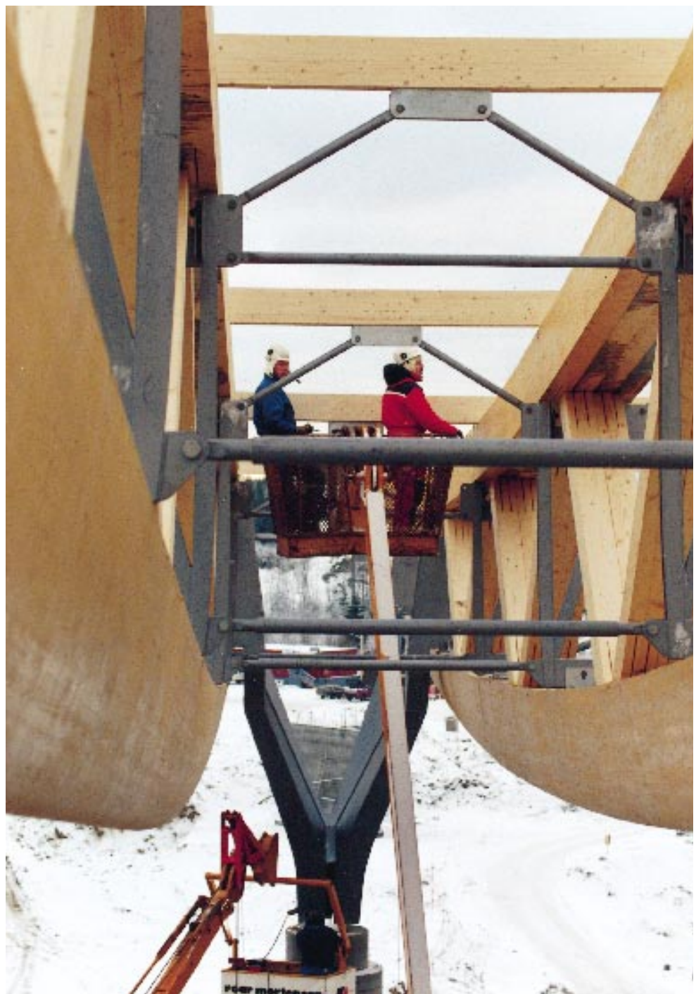
Trevirke har mange anvendelsesområder. Det er et naturlig og levende materiale med varierte bruksområder og -muligheter. Produktutvikling som vektlegger markedskravene er viktig for å konkurrere med andre materialer. Limtre bidrar til å holde Gardermoen oppe, bildet er tatt fra Gardermoutbyggingen.

Skogkultur er grunnleggende i et bærekraftig skogbruk. Det er nødvendig med et fortsatt statlig engasjement i de langsiktige investeringene som er forbundet med en aktiv skogkultur. Departementet vil legge vekt på at skogkultur og skogskjøtsel fremmer et variert råstofftilbud og produksjon