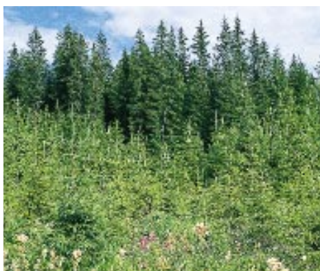
Skogsektoren har både direkte og indirekte positive effekter i et klimaregnskap. Skog i vekst tar gjennom fotosyntese opp CO 2 fra luften, og binder noe av karbonet i trevirke mens oksygenet frigjøres til luften.

Regjeringen mener miljøprofilen i skogpolitikken må bli tydeligere og mer synlig. De positive miljøbidragene fra skogressursene skal forsterkes bl a gjennom bedre integrering av trevirke og skogprodukter i aktiv utvikling av bærekraftige produksjons- og forbruksmønstre. Skogsektoren har samtidig et selvstendig miljøansvar. Det er fortsatt forbedringsmuligheter når det gjelder de miljøhensyn skogbruket har ansvaret for, tross stor innsats fra myndighetene og næringen selv.