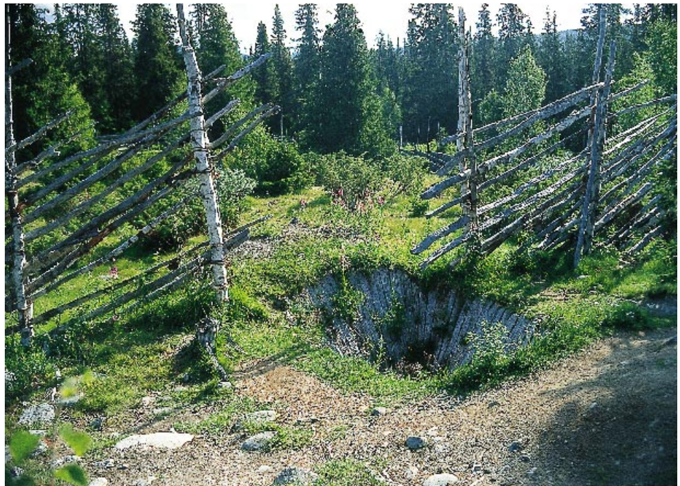
Skogbruket må ta ansvaret for de miljøtilpasninger som er nødvendige av hensyn til biologisk mangfold, kulturminner og andre miljøverdier. Bildet viser en restaurert elgrav ved Dokkfløy.

Skogpolitikken må ha en sterk og tydelig miljøprofil som inngir tillit nasjonalt og internasjonalt. Miljøkravene til skogbruket er blitt sterkere, og det er større etterspørsel etter dokumentasjon på at skogproduktene kommer fra et bærekraftig skogbruk. I dette ligger det nye utfordringer, men også muligheter for å gi det norske skogbruket konkurransefortrinn. Forutsetningen er en høy miljøinnsats. Det må arbeides videre med å finne effektive og pålitelige løsninger på dokumentasjonen av bærekraftig skogproduksjon i Norge.