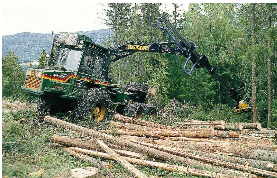
Stadig flere bønder og skogeiere henter inntekt i annen virksomhet enn landbruk. Utnyttningen av skogressursene på mange eiendommer blir derfor mindre aktiv. Effektivisering av skogsdriften er en naturlig konsekvens av redusert lønnsomhet. Om lag halvparten av avvirkingen foretas i dag av profesjonelle skogsentreprenører.

Departementet vil følge utviklingen nøye når det gjelder kommunenes innsats som det viktige førsteleddet for gjennomføringen av skogpolitikken. Det er aktuelt å gjennomføre en mer omfattende kartlegging og evaluering av situasjonen.