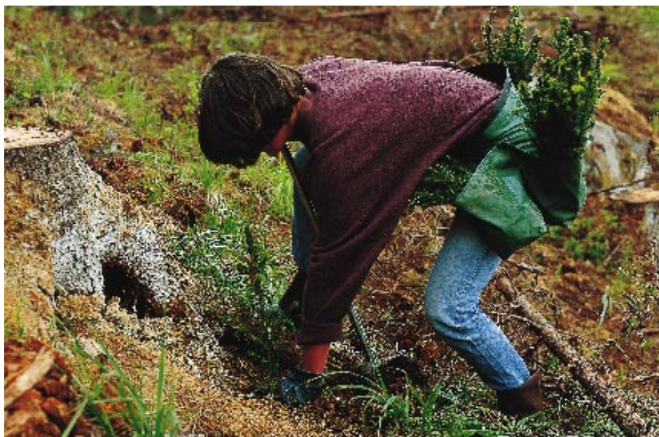
Siden begynnelsen av 1990-årene har omfanget av skogplanting sunket dramatisk. Det er større interesse for og større omfang av naturlig foryngelse, men samtidig forsømmer mange skogeiere tilretteleggingen for ny foryngelse på for store arealer. Regjeringen foreslår derfor å innskjerpe foryngelsesplikten i en ny skogbrukslov.

Regjeringen tar sikte på å fastsette en miljøforskrift hjemlet i skogbruksloven så snart Stortinget har behandlet meldingen. En slik forskrift kan legge til rette for en god sammenheng mellom resultatene fra samarbeidsprosjektet Levende Skog og det offentlige regelverket, og kombinere det frivillige og det lovmessige i en tillitvekkende faglig og politisk helhet som kan bli en styrke for næringen. Departementet vil følge opp høringsuttalelsene og resultatene fra Levende Skog med sikte på å utforme forskriften slik at miljøforskriftens bestemmelser vil ligge på samme nivå som standardene fra Levende Skog. Prosessen frem mot en forskrift vil være vesentlig mindre tidkrevende enn den foreslåtte totalgjennomgang av skogbruksloven, og slike bestemmelser vil derfor raskere kunne inngå i den norske skogpolitikken.