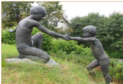
Statuen "Søstre" av Marit Wiklund, som står utenfor administrasjonsbygget på Hellerud, symboliserer betydningen av "en hjelpende hånd", en holdning Norges Vel er opptatt av og identifiserer seg med.

Postboks 115, 2026 SKJETTEN Tlf: 64 83 20 00 Faks 64 83 20 01