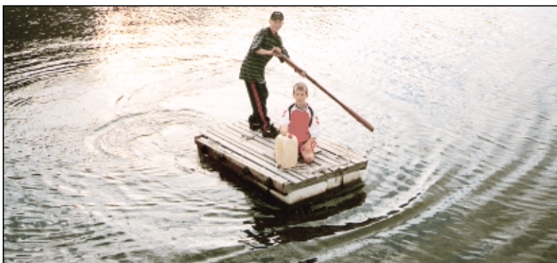
Neppe noe godt alternativ til bro.

Finansieringsplanen har en totalramme på 7,3 millioner kroner, og dette omfatter både kommunal egenandel, statlige tilskudd og overføringer. Oversiktene så langt viser et forbruk på 6,5 millioner, men da gjenstår også supplerende grunnundersøkelser og ferdigstilling av gang- og sykkelveiforbindelse nordover mot trafikkanlegget på Ørebekk. Fredrikstad kommune arbeider for tiden med å løse de tekniske og formelle vanskelighetene en slik videreføring medfører.