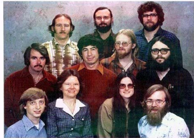
Microsoft Corporation, 1978