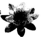
"Nøkkerosa" 'Nymphaea alba'