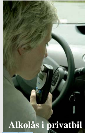
Alkolås i privatbil