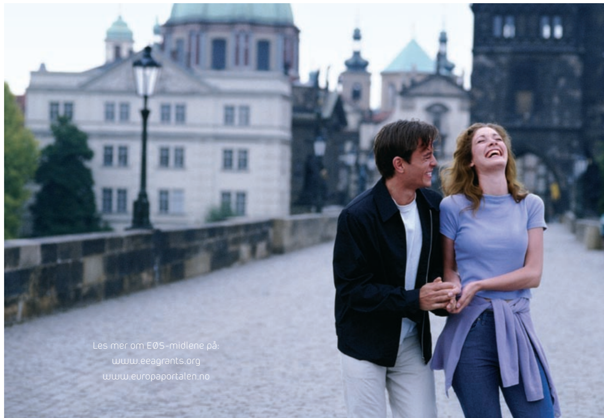
Utenriksminister Jonas Gahr Støre, mai 2006

Les mer om EØS-midlene på: www.eeagrants.org www.europaportalen.no