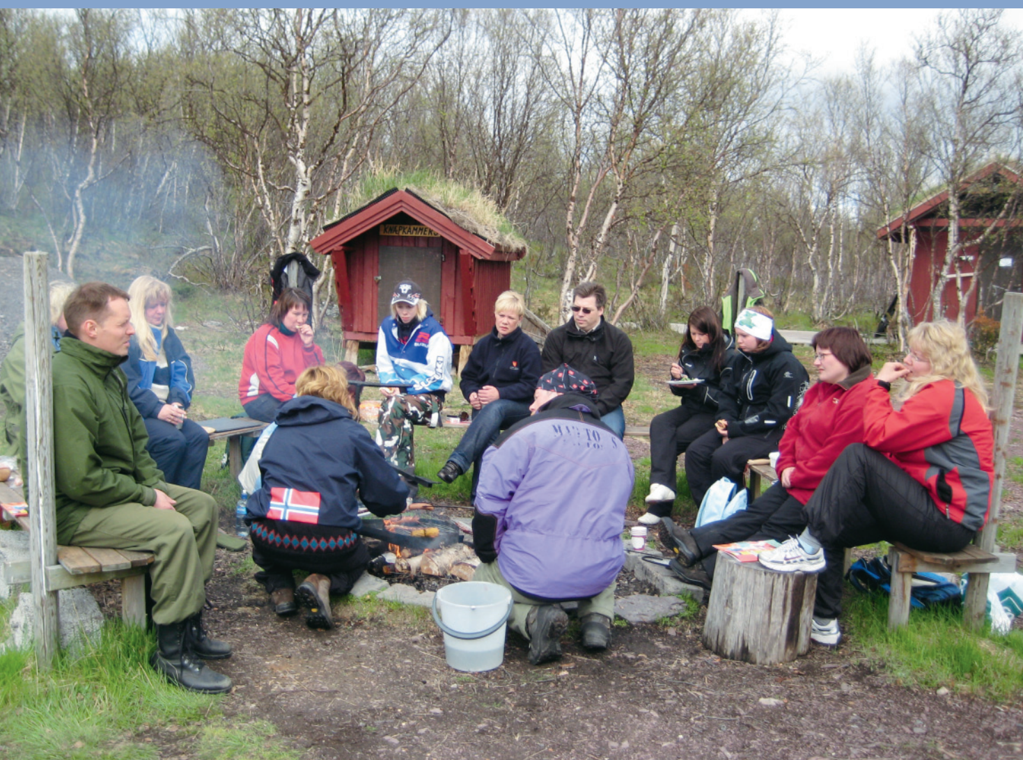
Botjenesten samlet til personalmøter ved Harrevann. Tema: HMS arbeid.