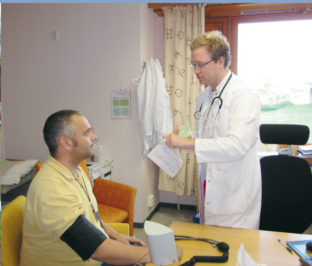
Det ble ingen sykemelding på nav lederen...