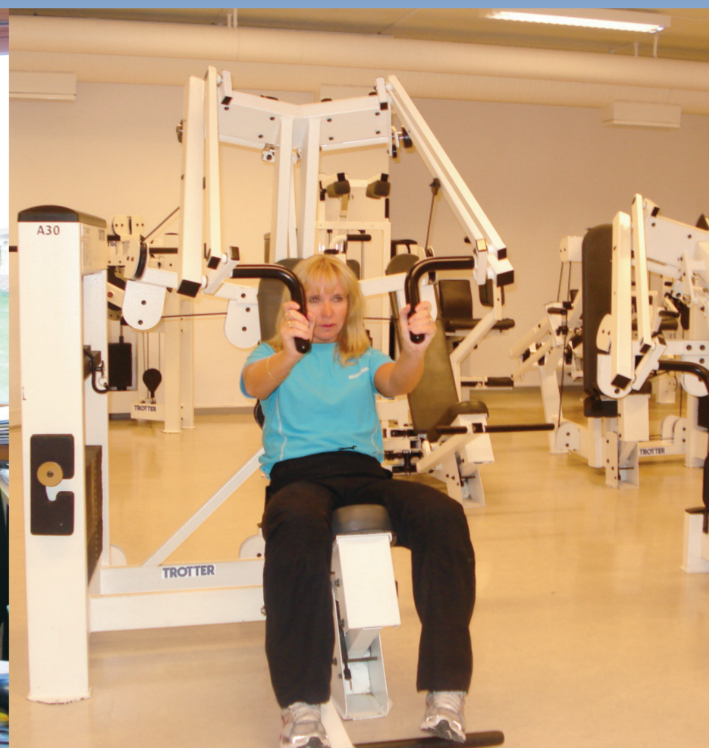
Kommunen har eget treningsstudio hvor ansatte kan trene nesten gratis.