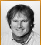
Rune Sandland Arkitektur og Standardisering