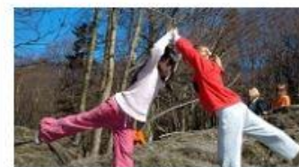
Barn og unge