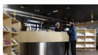
Ledelse og administrasjon