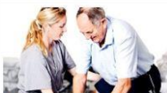
Helse og omsorg