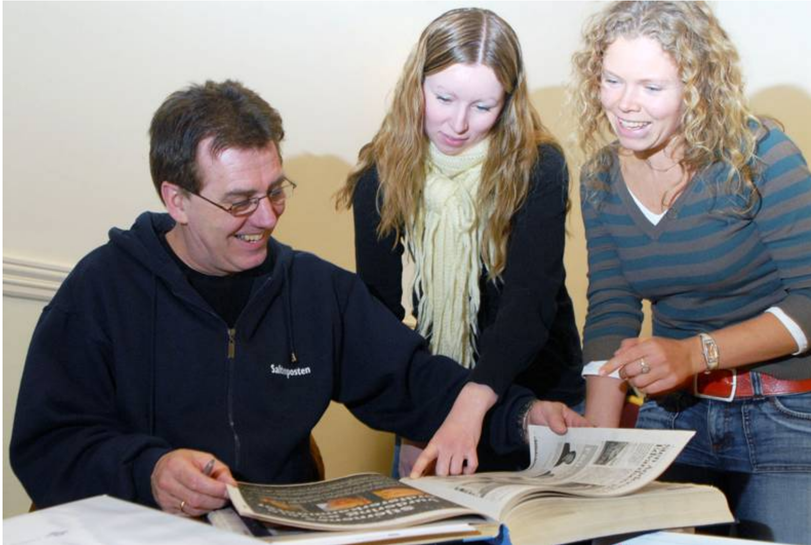
Medarbeidarar frå Saltiposten på valkurs i Bodø.