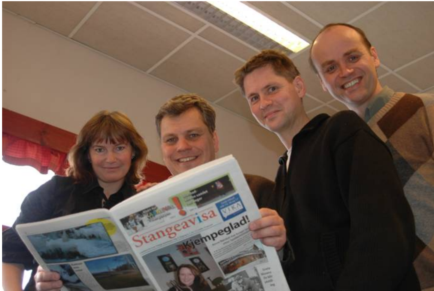
Årets opplagsvinnar; Fire år gamle Stangeavisa

Om lag 150 superlokale aviser blir lesen av 2 million menneske kvar veke Framgangen held fram og stadig nye aviser blir etablert