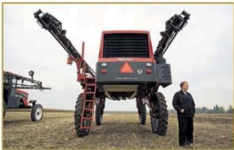
SI DEN BOMM: De fleste af verdens Agri-Business er for store til at sælge til for de små lande de de store lande. Derfor er alle investorer, leverandører og tjenesteydere nødt til at sælge deres produkter til den tredje verden.

– Vi møder længslet, for det har været 5-10 års produktivitet på jorden her. Nu har jeg brugt 10-15 år og er helt glemmed med bær og træ. Vi begynder på jorden fra nul, fortæller Westberg. – Vi kigger nu kun på jord i Danmark, og i dag er det svært at få gode investeringer i verden rundt. Det er kun i de store lande som USA, Brasilien og Australien, der er der stadig mulighed for at få gode investeringer i jord, siger Westberg.