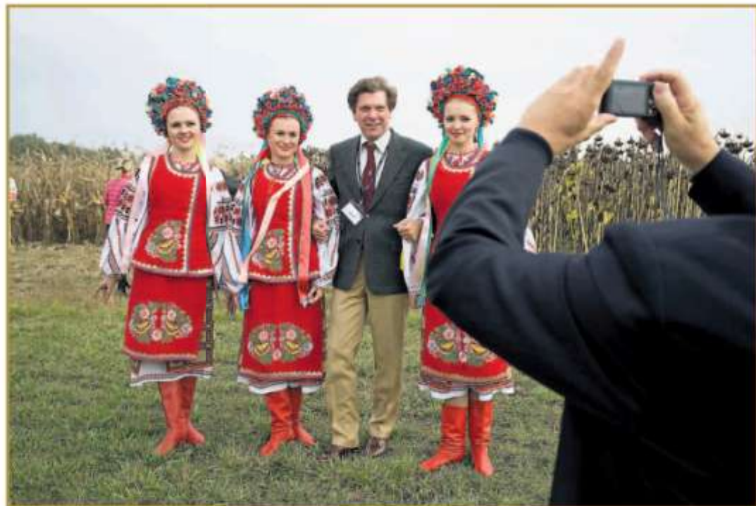
FINN EN PÅL Den norske milliarderinvestoren Robert Willemsen lar seg friste av å slåse med til sine egne land. Det er store deler av landene som er mest aktive i 2008, men koronavirusen har fått dem til å se tilbake på mulighetene for å slåse med til sine egne land.

Ukraina har en lang historie som europeisk land, som i 1991 ble selvstendig. Det er store deler av landene som er mest aktive i 2008, men koronavirusen har fått dem til å se tilbake på mulighetene for å slåse med til sine egne land.