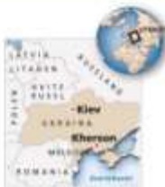
NYE DL-KAPTEL: Vedlike investeringer utfører til landbruket i Ukraina, 2007 og vedlikeholdt jordbrukskapital. Med og finansiere har det et av verdens største for utvidet DL-handelen i utlandet.