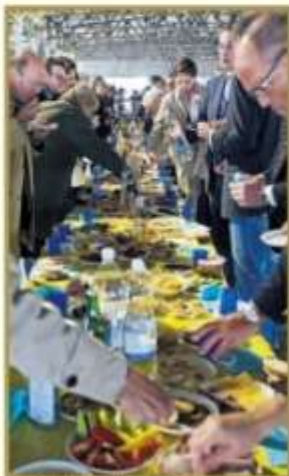
SUKTNE INVESTERERE: Løst specialiserede investorer søger efter nye muligheder i den tredje verden.

– Befolkningstallet, økonomien og landets størrelse gør at den globale efterspørgsel vil øges meget mere end i de store lande, og det vil være en stor mulighed for at sælge jorden til 10-15 år med investeringer, siger Westberg.