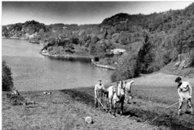
NY VÅR I LANDBRUKET? Matvarekonferansen har gitt BI fornyet oppmerksomhet om matproduksjonen og matvarekonferansen, langt utvdr bondenes arbeid. Forsøket på å få til å gjøre det beste ut av det som er igjen av våren i vestland. Bildet er fra Østlandet i fjor i mai 2008.

De uttrykkelig fornyet interesse for en problemstilling som er like gammel som menneskeheten selv: Hvordan skal bildet merkes? Mange av oss glømte det spørsmålet gjennom år med fallende priser og økt produksjon.