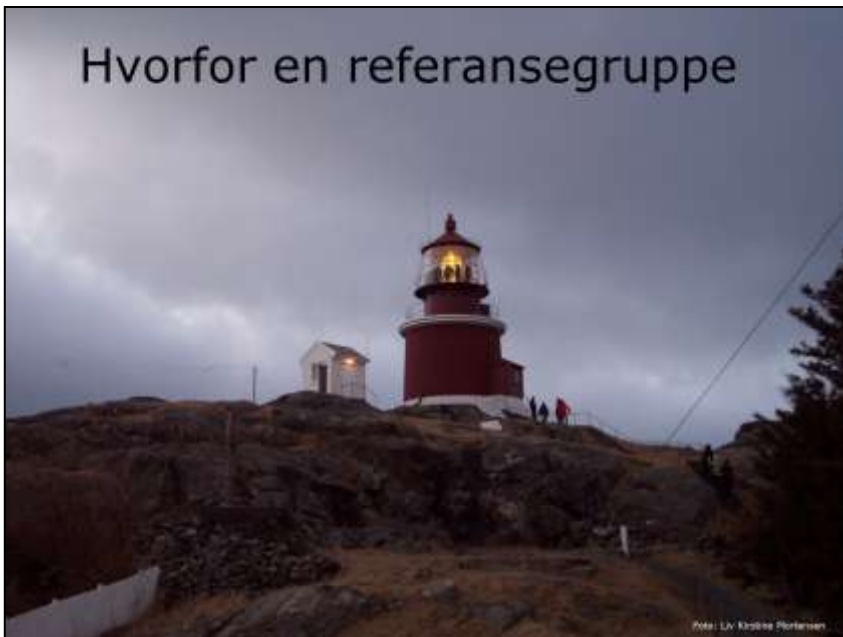
Bildet er fra fyret på Utsira

Slik vi skrev i invitasjonen ønsker Miljøverndepartementet å opprette en faglig referansegruppe for landskapskartlegging spesielt knyttet opp mot metodeutvikling.