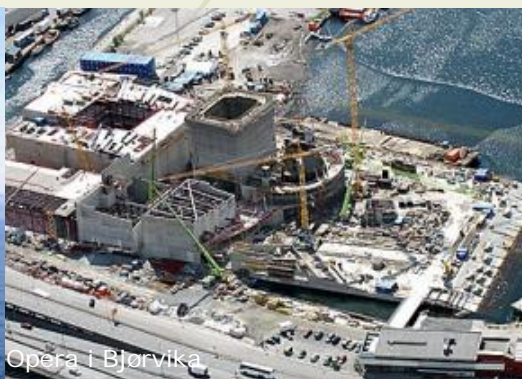
Opera 1 Bjørsvika