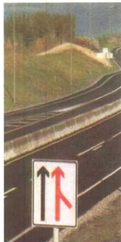
En vei med solid midtdeler hvor forekomme.

I oversendelsesbrevet, datert 5. mars 2008 til Samferdsels-departementet (SD) ble det anmodet om en