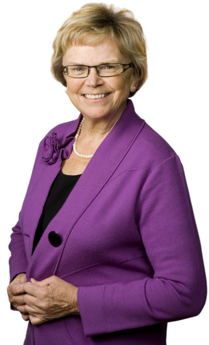
Magnhild Meltveit Kleppa Samferdselsminister

Denne strategien forsøker å balansere innføringen av ny teknologi opp mot grunnleggende individuelle rettigheter. Vi har også lagt vekt på å utarbeide prinsipper for ansvars- og oppgavedeling slik at vi får en tjenlig og hensiktsmessig arbeidsdeling mellom aktørene på dette feltet. Strategien er forankret i Nasjonal Transportplan og utformet i samarbeid med fagmiljøene i transportetatene, Avinor AS og ITS Norge.