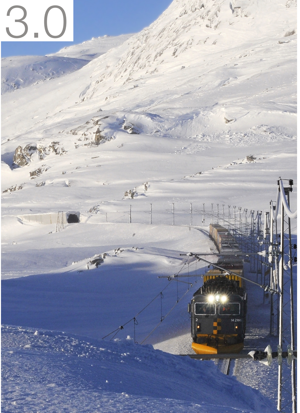
Cargonet – Bergensbanen

Et ITS-system vil kunne omfatte personopplysninger og annen informasjon som krever spesiell behandling og eventuell konsesjon fra Datatilsynet. Dette har blant annet bakgrunn i at slike systemer ofte generer store mengder informasjon som kan utfordre personvernet eller misbrukes til ulovlig virksomhet. Samferdselsdepartementet legger derfor til grunn at alle tiltak på dette området tar hensyn til personvernet slik lovverket krever.