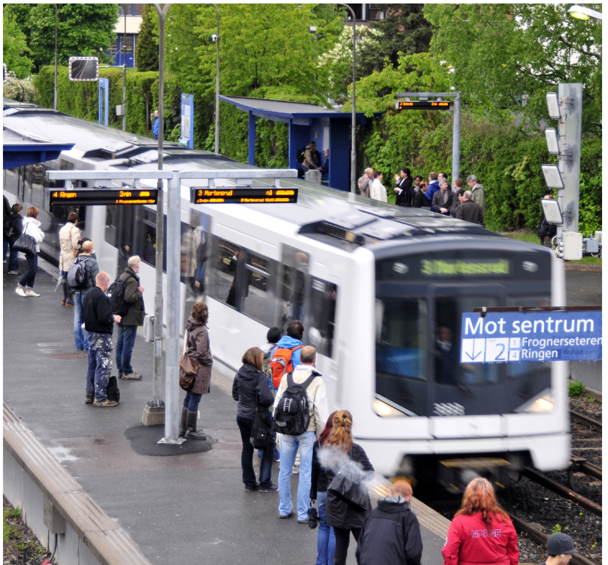
T-bane – Brynseng stasjon

Samferdselsdepartementet yter årlig driftsstøtte til ITS Norge. Formålet med ITS Norge er å øke nytten av ITS i norsk transport som helhet, blant annet for å fremme multimodalitet. Det vil si at alle transportformer skal fremstå i et samlet perspektiv, og organisasjonen vil arbeide for å forbedre effektivitet, sikkerhet, brukervennlighet og miljø i alle deler av transportsystemet. Både offentlige og kommersielle aktører er med i ITS Norge. Samferdselsdepartementet har tillagt ITS Norge oppgaver knyttet til koordinering av ulike type aktører og fagmiljøer samt forvaltning av felles, multimodalt rammeverk.