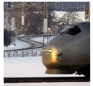
Flytoget Leirsund–Frogner