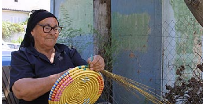
Tradisjonelt håndverk på Kypros.

Konsultasjonene med Kypros om rammeavtale og prioriteringer ble innledet i Nicosia 14. juni 2004. Norske myndigheter og FMO har siden hatt jevnlig kontakt og møter med Kypros Planning Bureau (Focal Point) i påvente av et utkast til rammeavtale og prioriteringer. Dette ble oversendt giverlandene i begynnelsen av april 2005.