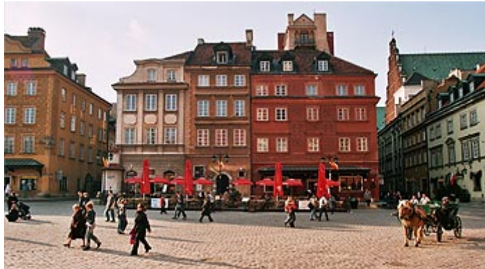
Arkitektur i Warszawa

Polen undertegnet begge rammeavtalene om bruken av EØS-finansieringsordningene høsten 2004. Siden har Polen arbeidet med en plan for nasjonal gjennomføring av ordningene. Polsk National Focal Point er i disse dager opptatt av å forberede utlysning av midlene, mottak av søknader, etablere intern struktur og legge rammene for et NGO-fond.