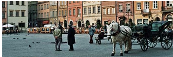
Fra Warszawa. Kulturarv er blant innsatsområdene som kan støttes.

EØS/EFTA landene har etablert to finansieringsordninger; én fellesordning med bidrag fra de tre EØS/EFTA landene til en verdi av omlag 5 milliarder kroner, og én særskilt norsk ordning til en verdi av omlag 4,7 milliarder kroner.