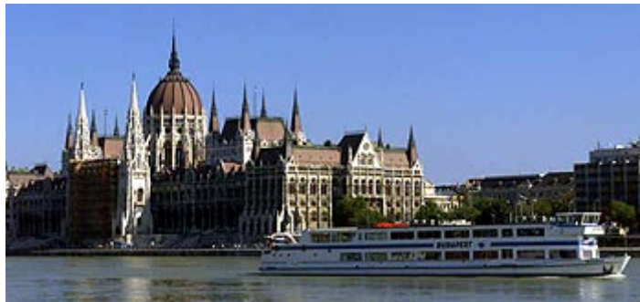
Den ungarske parlamentsbygningen i Budapest.

Utkast til rammeavtale og prioriteringer er ferdigstilt. Det er planlagt lanseringsseminar og undertegning 10. juni i Budapest. Ungarn ønsker å lyse ut midler allerede i mai 2005, med forbehold om at alle formelle klareringer vil skje.