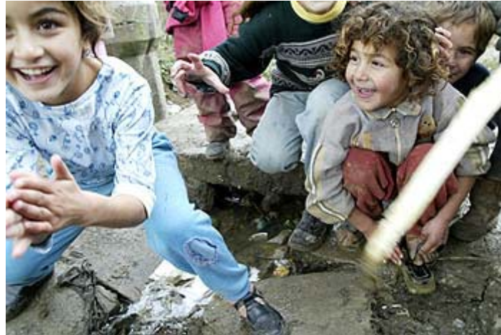
Roma-befolkningen kan støttes gjennom EØS-finansieringsordningene

Ett år etter utvidelsen av EU/EØS og etableringen av EØS-finansieringsordningene, er rammeavtaler (MoU) undertegnet med 9 av 13 mottakerland: Polen, Tsjekkia, Latvia, Estland, Slovakia, Portugal, Litauen, Slovenia og Malta. Dialog og forhandlinger med mottakerlandene om innholdet i rammeavtalene har vært hovedfokus i EØS-finansieringsordningenes første leveår.