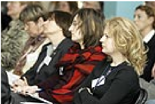
Seminar for over 160 representanter fra norske og polske frivillige organisasjoner i Warszawa 7. april 2005.

Polen er største mottakerland under EØS-finansieringsordningene og har satt av 7 prosent av midlene til et polsk NGO-fond. Dette innebærer en ramme på omlag 300 millioner kroner fram til 2009. Andre land som planlegger å etablere NGO-fond under EØS-finansieringsordningene er Tsjekkia, Slovakia, Litauen, Latvia, Estland, Slovenia og Portugal.