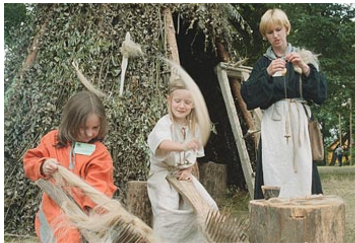
Barn fra Litauen i et historisk friluftsmuseum i Kernave.

I 2005 ble det avholdt to konsultasjoner med Litauen, den første 17. januar 2005, hvor annekset A ble diskutert med spesielt fokus på kontroll og revisjonsrutiner. Det ble klart at Litauen i første omgang ikke ønsker å bruke norske midler til prosjekter innen miljø og Schengen, da disse områdene var godt dekket av EU-midler. Litauen vil fokusere på prosjekter inne kulturarv, helse, regional utvikling, forskning og styrking av justissektoren. Litauen ønsker videre at finansieringsordningen skal styrke det bilaterale samarbeidet mellom Norge og Litauen. Et eget fond for frivillige organisasjoner vil bli opprettet.