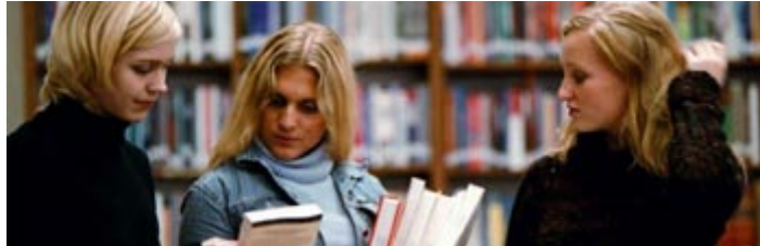
Jus-studenter i biblioteket til Eurofaculty ved Latvia State University. EØS-finansieringsordningene kan støtte utdanning og forskning.

EØS-finansieringsordningene ble etablert 1. mai 2004, da EU og EØS ble utvidet med ti land: Tsjekia, Estland, Kypros, Latvia, Litauen, Malta, Polen, Slovenia, Slovakia, og Ungarn. Gjennom ordningene bidrar Norge med om lag 9,5 milliarder kroner til sosial og økonomisk utjevning i det utvidete EØS-området i perioden 2004-2009.