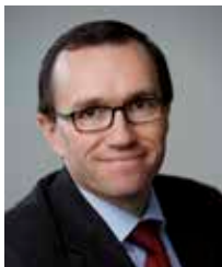
Espen Barth Eide