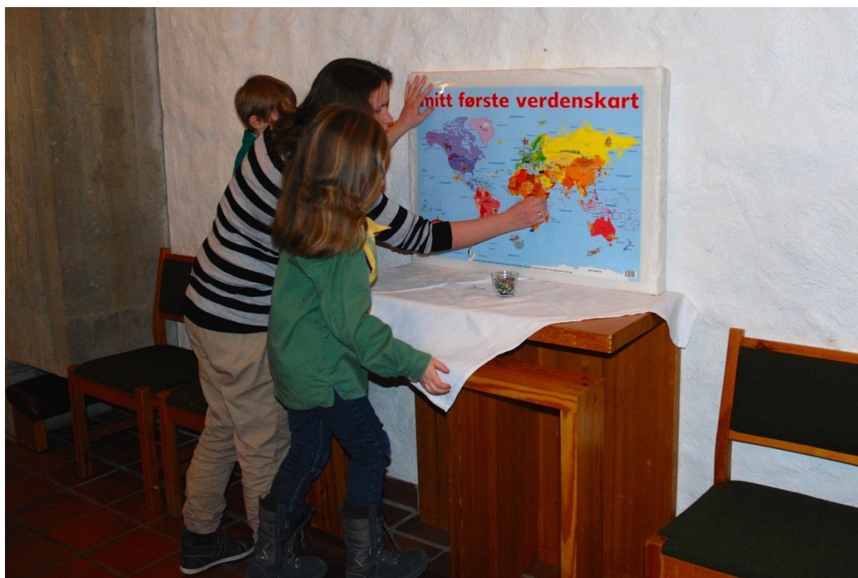
Speidarar på bønemandring i Rossabø kyrkje

Erfaringane frå 2015 tyder på at ein skal fortsetta å fokusera meir på kvalitet i misjonsavtalene enn på kvantitet. Her ligg det eit særskilt ansvar på dei SMM-organisasjonane som har mange avtaler i bispedømmet. Elleser det viktig å satsa vidare på kompetanseutvikling. Kyrkjelydane treng å bli utfordra på kor viktig misjon er og korleis dei kan setta misjon i fokus. I 2016 vil det både bli satsa på nye sokneråd og misjonsutval, og me vil fokusera tematisk på satsingsområde hos organisasjonane som kan vera særleg relevante for kyrkjelydane.